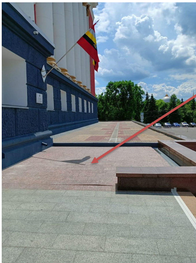
Фото 3. Территория объекта культурного наследия регионального значения «Дом Советов» 1939-1951 г.г. Участок проведения работ.