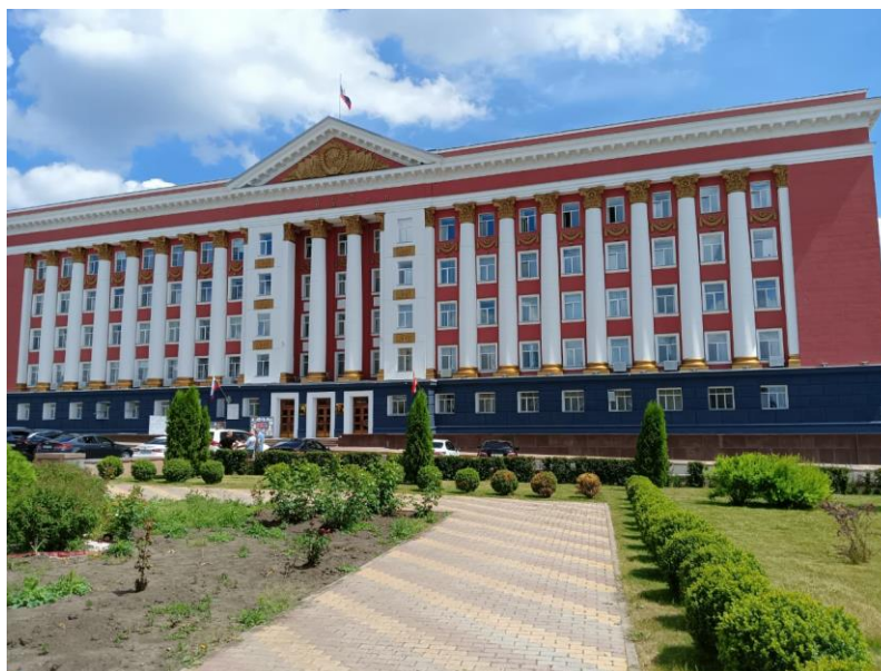
Фото 1. Объект культурного наследия регионального значения «Дом Советов» 1939-1951 г.г. Главный фасад здания.

Результаты визуального обследования строительных конструкций объекта культурного наследия регионального значения «Дом Советов» 1939-1951 г.г., расположенного по адресу: Курская область, г. Курск, Красная площадь, д. 1, позволяют оценить общее техническое состояние в целом как работоспособное, т.е. механическая безопасность здания обеспечена.