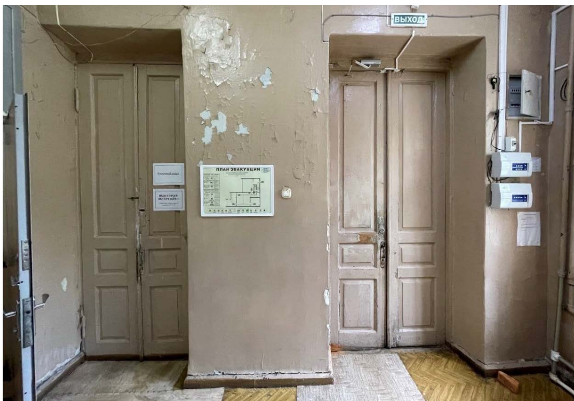
Фото 5. Интерьеры. Помещения 1-го этажа. Выход на лестничную площадку.