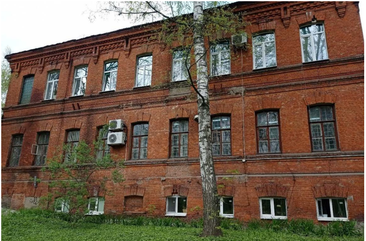
Фото 3. Южный фасад Объекта.