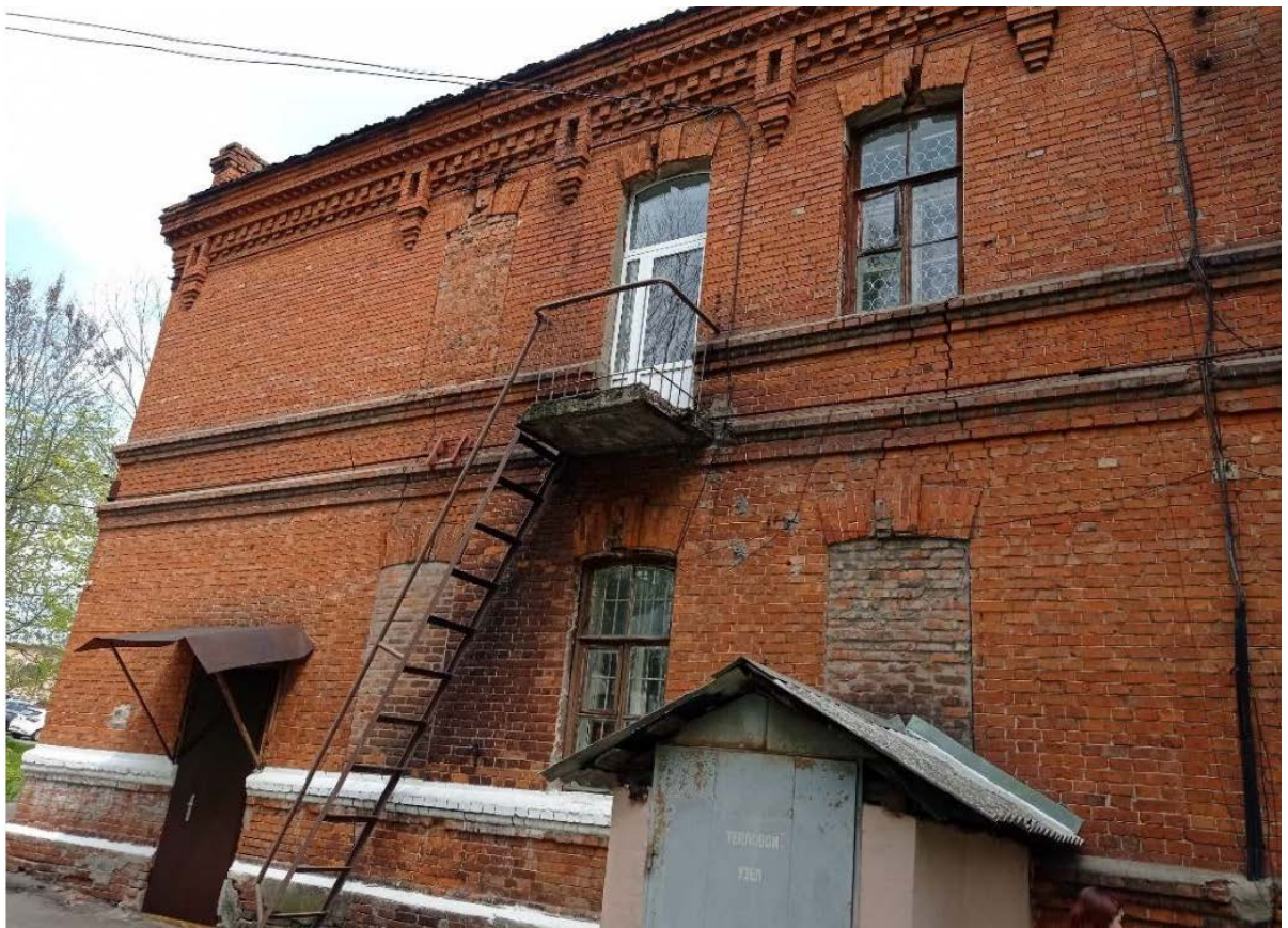
Фото 4. Восточный фасад Объекта.