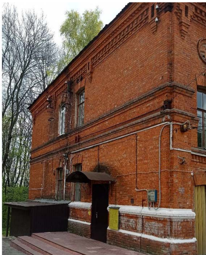
Фото 2. Западный фасад Объекта.