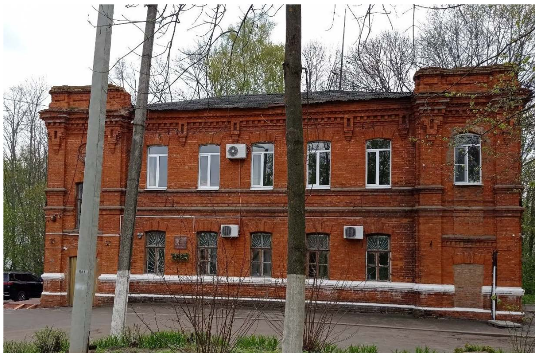
Фото 1. Общий вид Объекта со стороны северного фасада.

Фотофиксация Объекта выполнена на момент заключения договора на проведение настоящей историко-культурной экспертизы