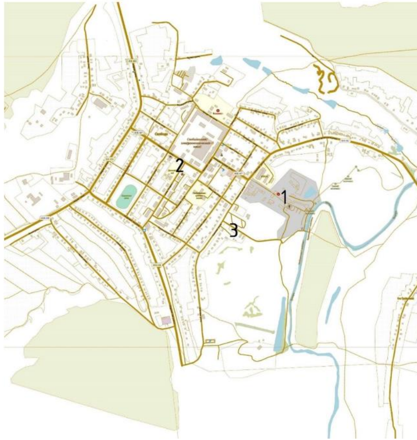
Схема расположения градообразующих объектов-факторов на территории м. Свобода Золотухинского района Курской области

- историко-мемориальный музей «Командный пункт Центрального фронта», 1975 г. (отмечено на схеме под цифрой 3).