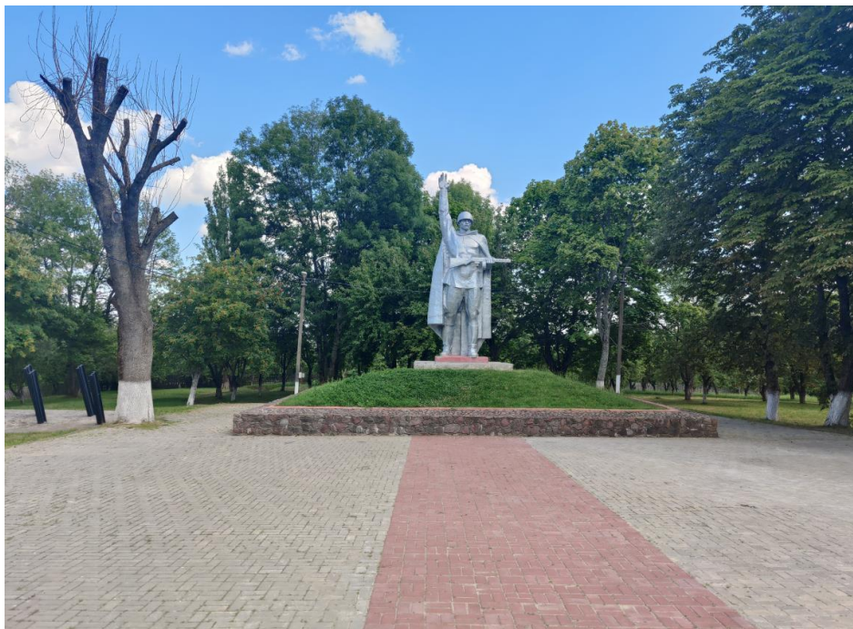
Общий вид объекта культурного наследия