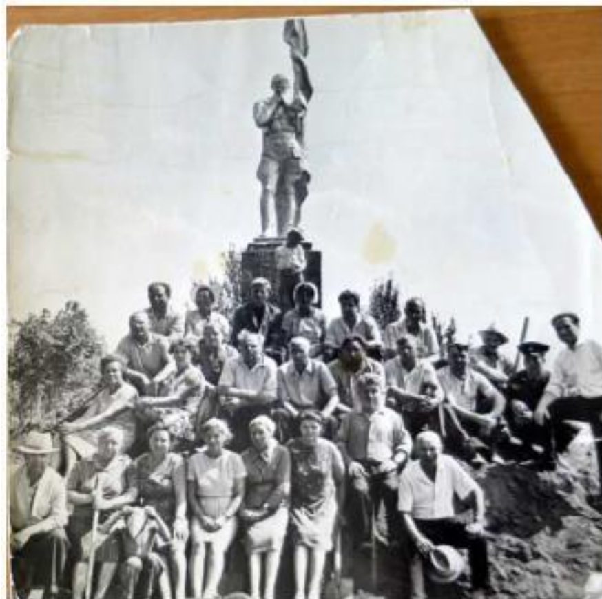
Мемориал «Командный пункт Центрального фронта». Главная аллея. На кургане установлена первоначальная скульптура воина с флагом, которая в дальнейшем была перенесена на братскую могилу воинов на гражданском кладбище с. Долгое Золотухинского р-на.

По воспоминанию работников мемориала в 1970 г. было проведено благоустройство сада: проложены дорожки, установлена садовая мебель, произведено озеленение. В 1972 г. на насыпном кургане была установлена типовая гипсовая статуя солдата освободителя с флагом. После этого на мемориал обратили внимание партийные органы и начались масштабные работы по строительству реплики блиндажа, памятной стелы и новой авторской монументальной скульптуры (предыдущая скульптура была перенесена на братское кладбище в с. Долгое Золотухинского р-на).