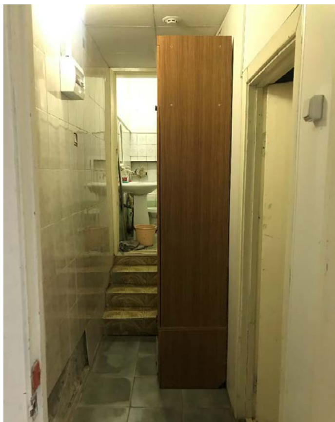
Фото 6. Интерьеры здания.