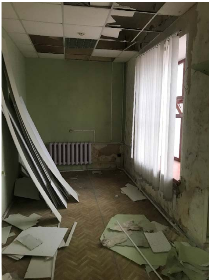
Фото 5. Интерьеры здания.