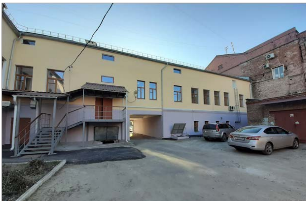
Фото 2. Западный фасад здания.