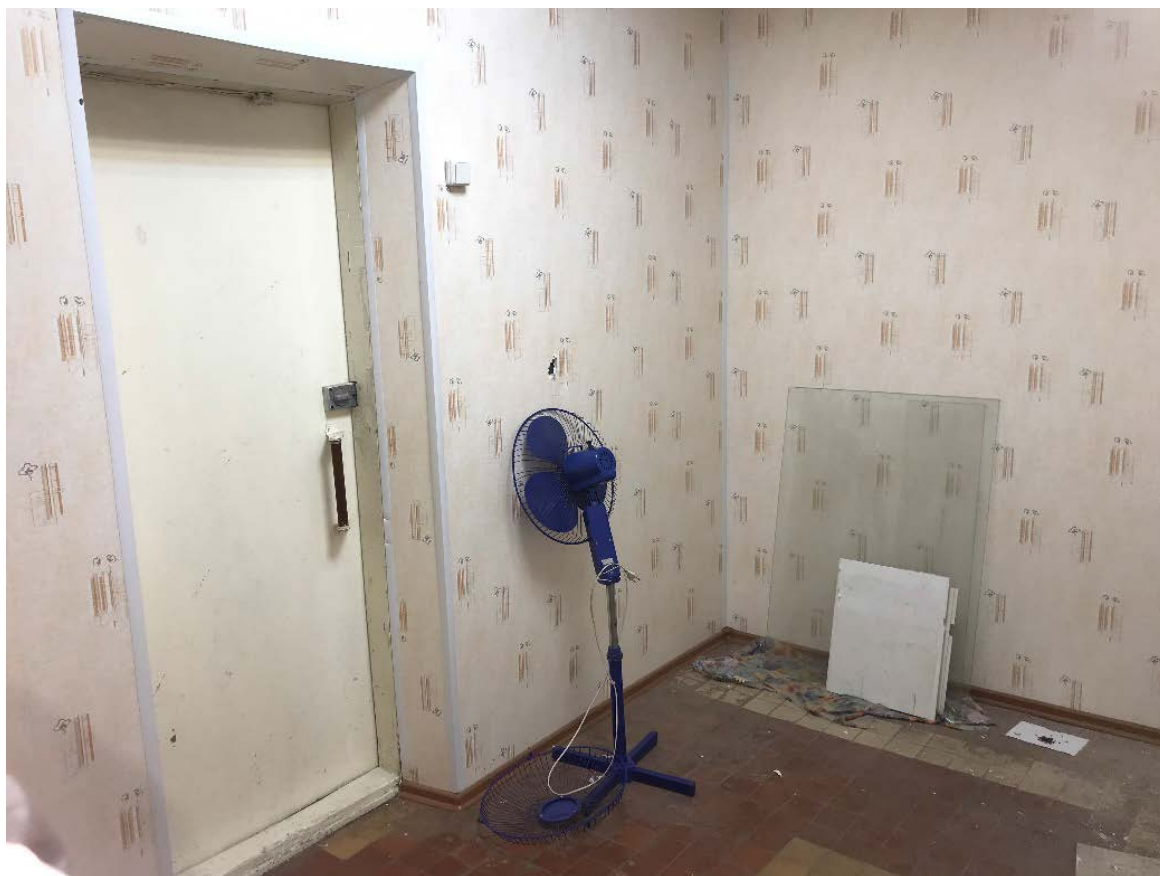
Фото 4. Интерьеры здания.