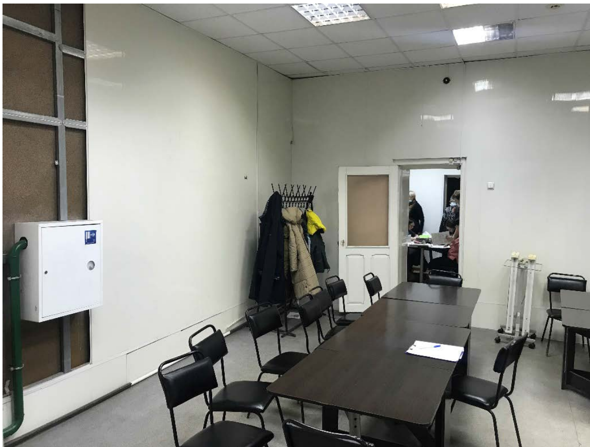
Фото 3. Интерьеры здания.