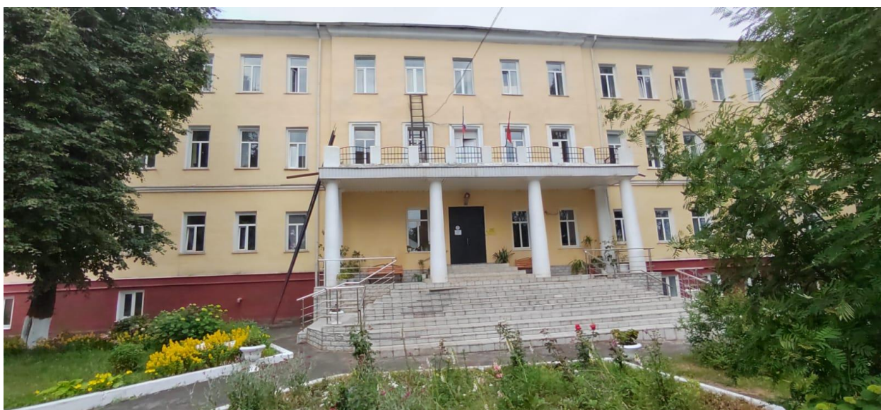
Фото 1. Выявленный объект культурного наследия «Тюрьма, кон. XVIII - нач. XIX».

В ходе разработки Раздела были проведены историко-архивные, историко-градостроительные и натурные исследования; оценена современная градостроительная ситуация на участке проектирования и прилегающей местности; выполнен анализ действующей градостроительной документации и ограничений в области охраны объектов культурного наследия; произведена оценка воздействия проводимых работ на выявленный объект культурного наследия регионального значения: «Раздел, по обеспечению сохранности выявленного объекта культурного наследия «Тюрьма, кон. XVIII - нач. XIX» (Курская область, г. Дмитриев, пл. Базарная, 13) , разработан необходимый перечень мероприятий, предотвращающих воздействие на Объекты при проведении капитального ремонта объекта « Капитальный ремонт здания общежития, расположенного по адресу: Курская область, г. Дмитриев, ул. Революционная, 25 а », (разработанного ОБУ «Курскгражданпроект» в 2022 году), как на физическую сохранность объекта культурного наследия, так и на сохранение условий его визуального восприятия в историко-градостроительном и природном окружении.