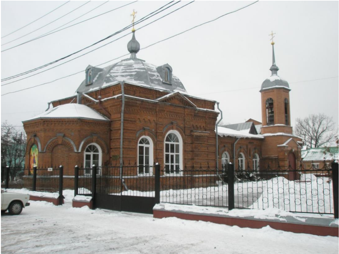
Фото октябрь-ноябрь 2023 года. Фасад со стороны ул. Полевой

Здание кирпичное, одноэтажное, сложной конфигурации в плане, в общих габаритах 9 (10) x 17 м. Под западной частью здания расположен небольшой подвал 6 x 12,5 м, высотой 2,5 м. Основной вход в церковь с запада, через позднюю пристройку тамбура.