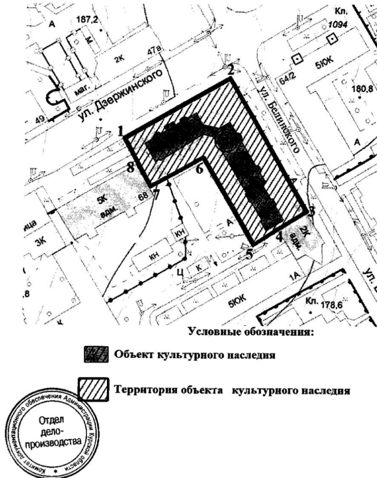
Схема (графическое описание местоположения) границ территории объекта культурного наследия регионального значения «Жилой дом с аркой», Курская область, г. Курск, ул. Дзержинского, 66