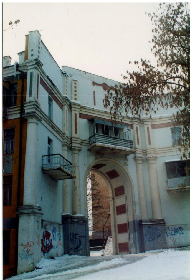
Фото Е. Холодовой Март, 2003 г.

Ист.: Габель В.Ф., Гулин И.Н. Курск. - М., 1951. - с.36