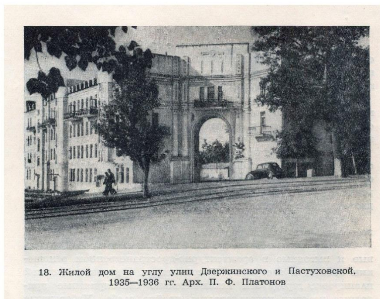
Фото ок. 1950 г.

Ист.: Габель В.Ф., Гулин И.Н. Курск. - М., 1951. - с.36