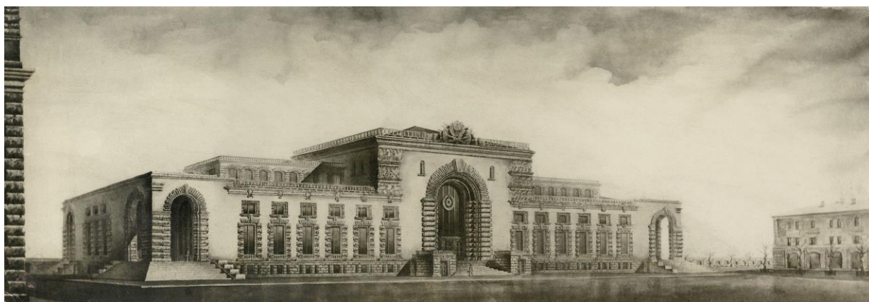
Технический проект. 1945–1946 годы. Фасад со стороны города Перспектива. Фотокопия с оригинала.

В Курском вокзале сразу обращает на себя внимание главный вход, оформленный в виде грандиозной, на весь фасад, арки-портала. В истории вокзал строения этот приём имеет солидную родословную и неизменно является одним из знаков железнодорожного вокзала.