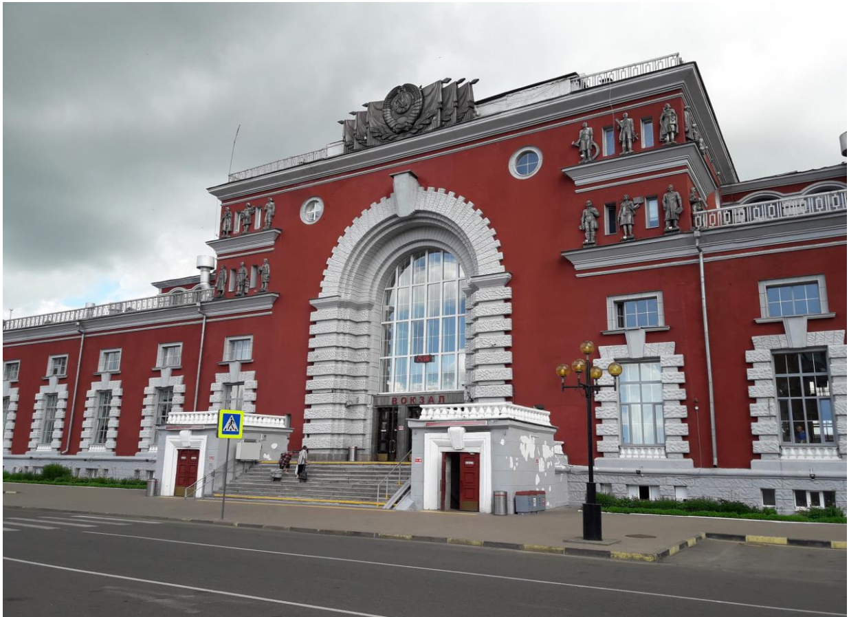
Фрагмент главного фасада вокзала станции Курск

Здание Курского вокзала решено в простых монументальных формах на основе творческой переработки архитектуры русского классицизма.