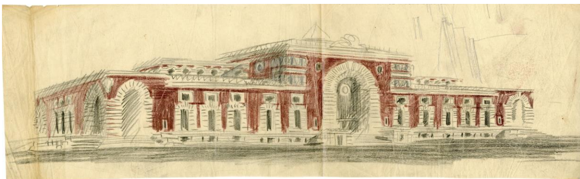
Проект. 1945–1947 годы. Фасад со стороны города. Перспектива. Эскиз. Бумага, карандаш, цветной карандаш

связанное как с привокзальной площадью, так и с пандусами, ведущими в тоннели к платформам, а также с кассами, багажными помещениями и прочими.