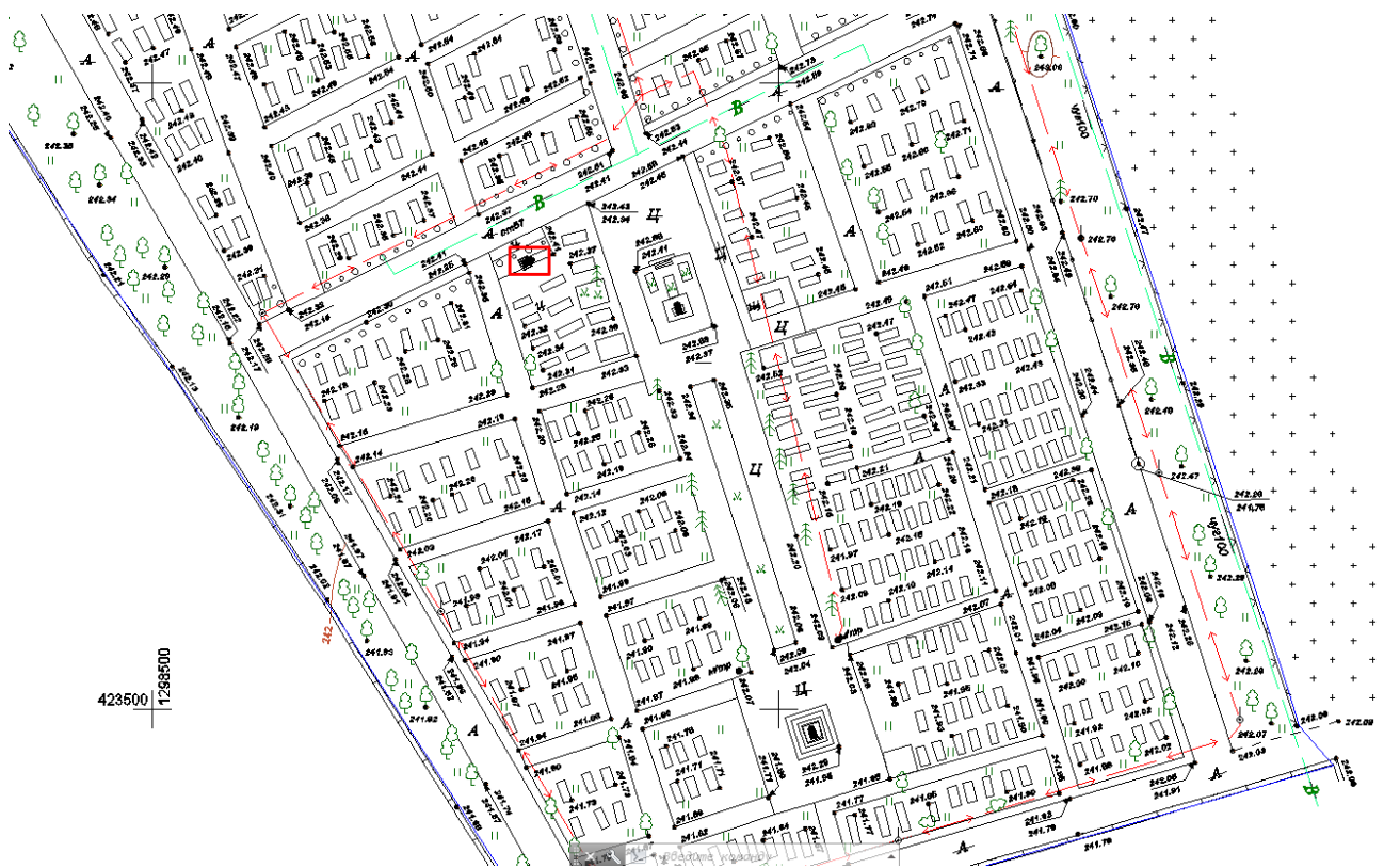
Исследуемая территория на геодезическом плане 2021 г. и место расположение объекта