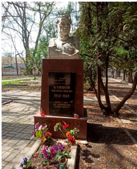
Вид на могилу Блинова К.М.

Постамент выполнен из монолитного железобетона, облицован красными гранитными плитками. На постаменте располагается бюст Блинова К.М. Перед постаментом устроено надгробие из бетона с мраморной крошкой.