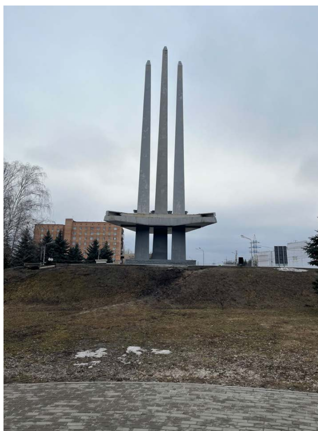
Фото 4. Общий вид Объекта с восточной стороны.