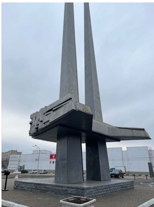
Фото 2. Общий вид Объекта с южной стороны.