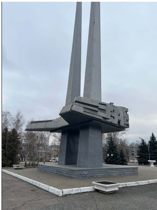
Фото 3. Общий вид Объекта с северной стороны.